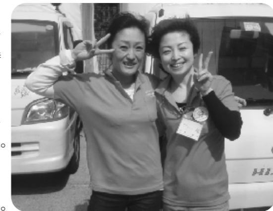
強風にも負けずに配達します

分配金についても自分たちで決めていくのですが、意見が分かれて納得がいけない結果になっても、とことん話し合っただけで決めたことなので、取りあえずはそれでやってみようと思えます。